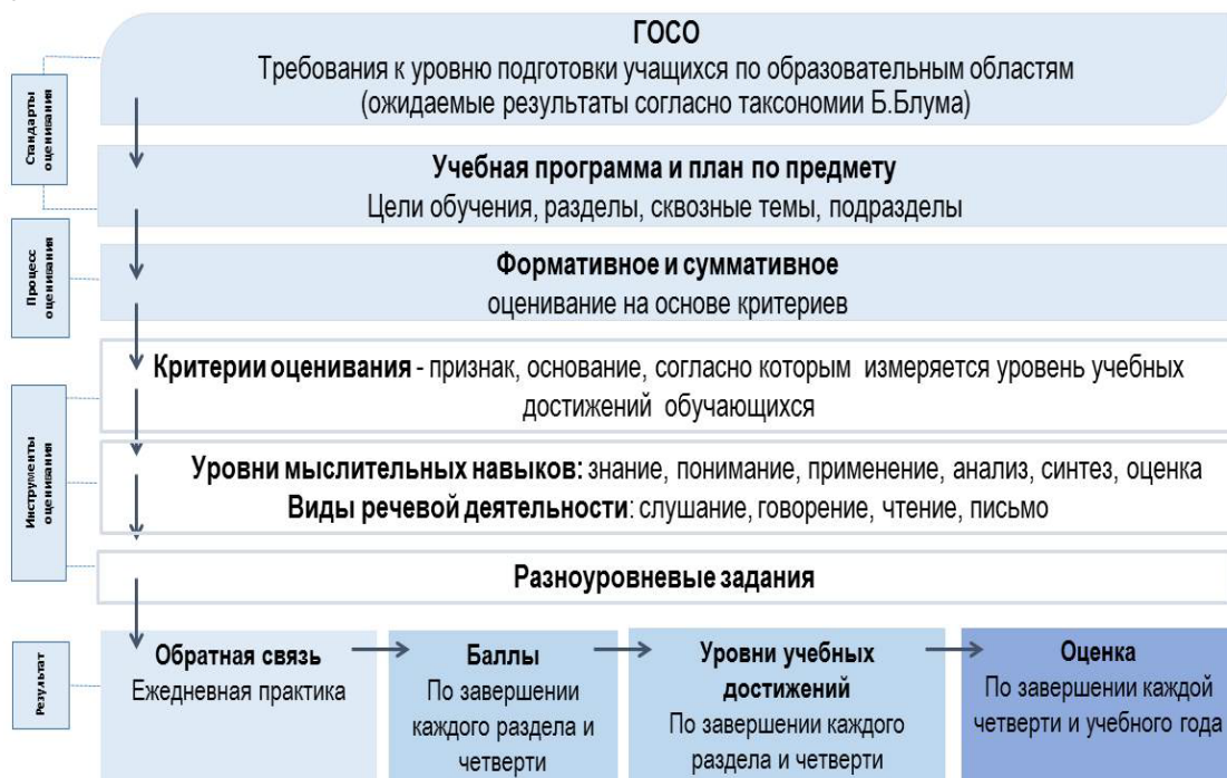
Рисунок 1. Содержание системы критериального оценивания

Содержание системы критериального оценивания определяется стандартами, процессами, инструментами и результатами оценивания (Рисунок 1).